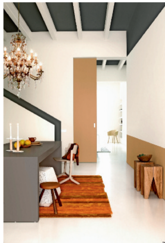
VERRASSEND: In plaats van grote kleurvlakken te gebruiken, wordt hier gespeeld met stroken en accenten in Magma en Gazelle die de architecturale lijnen van de kamers benadrukken. Ook het bureau kreeg een bijpassende, maar lichtere grijs tint in Schaduw/Ombre.