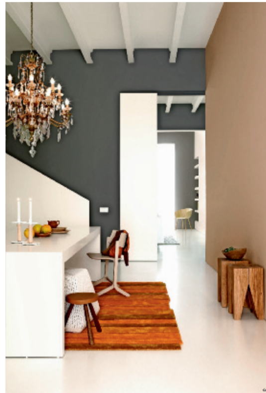
KLASSIEK MET EEN TWIST: De donkere muren in Levis Ambiance Magma geven de ruimte klasse. De uitstraling wordt nog benadrukt door de accentmuur in Suède. De schuifdeur is geverfd in Ivoorbeige/Beige Ivoire.

Tijd om zelf aan de slag te gaan en je lievelingskleuren uit te testen! Maak daarvoor gebruik van de handige Levis Stalenservice met kleurechte A5-stalen. Een staal kost 0,95 euro (btw en verzending inbegrepen). Je krijgt het binnen vijf werkdagen thuis geleverd, samen met een Levis-waardebon van 5 euro. Zo heb je echt geen enkel excuus meer om je droominterieur eindelijk vorm en vooral kleur te geven!