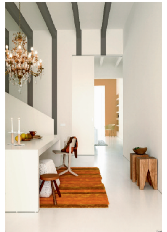
VOOR DURVERS: De plafondbalken werden extra in de verf gezet door ze in het zachtgrijze Schaduw/Ombre te schilderen en de lijnen op de muur te laten doorlopen. De muur achteraan kreeg een laag Gazelle en geeft het geheel meer diepte.